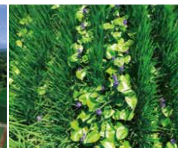
水田には、綺麗な水でしか生息しない絶滅危惧種指定のミズアオイの花が咲いています。