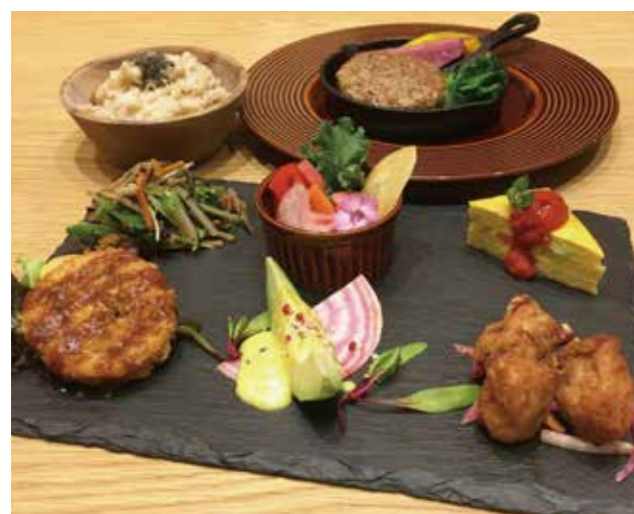
healthy vegetable course

北海道は旭川市。大雪山の伏流水で育まれた西神楽の水田で有機栽培米を育てる市川農場の市川範之さん。当店で市川さんが丹精込めて育てた、有機JAS認定の玄米を使用しています。