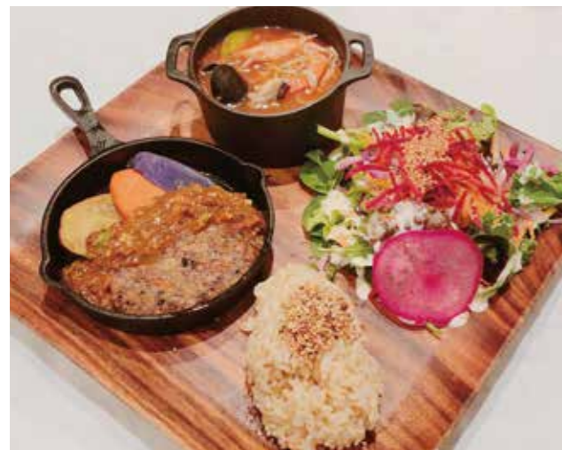
Bouillabaisse & Veggie-Hamburg with Maple and Whole-grain Mustard Sauce