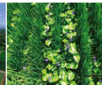
水田には、綺麗な水でしか生息しない絶滅危惧種指定のミズアオイの花が咲いています。