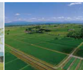
北海道の広大な大地で育てられています。