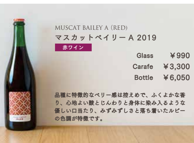
MUSCAT BAILEY A (RED) マスカットベイリー A 2019

フジマル醸造所のデラウェアらしい、パイナップルやバナナのようなトロピカルな香りと心地よい酸、すっきりと広がる果実味は今年も健在です。