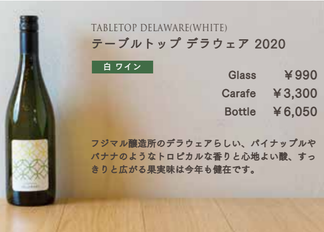
TABLETOP DELAWARE(WHITE) テーブルトップ デラウェア 2020

「土地とワインと人をつなげたい」という想いから誕生した「フジマル醸造所」のシティーワイナリー。日本各地の契約農家さんの丹精こめて作られたブドウを一本ずつ、心を込めて醸した自然派ワインをお楽しみください。