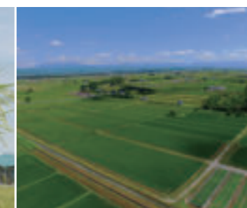
北海道の広大な大地で育てられています。