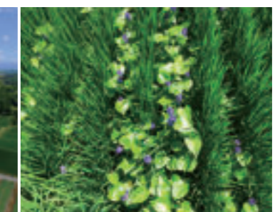
水田には、綺麗な水でしか生息しない絶滅危惧 種指定のミズアオイの花が咲いています。